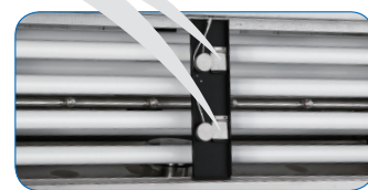
标配美国原装进口光源